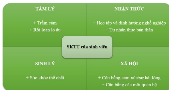
Hình 1: Các khía cạnh của SKTT của sinh viên